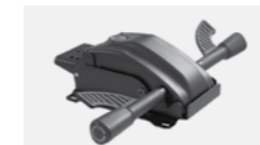
133/Z Synchro mech with seat slider and side tensioner. Meccanismo sincro con slitta sedile e tensionatore laterale.