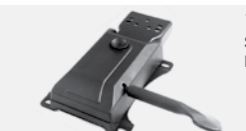
134/Z Self weight mech. Meccanismo auto-pesante.