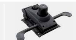
359/Z Synchro mech. Meccanismo sincro.