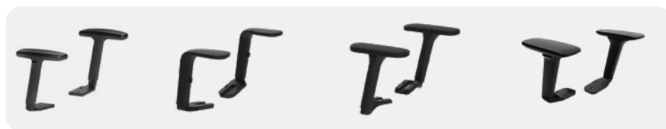
ARGA1BH0 1D/2D/3D arm, PU or nylon top. Bracciolo 1D/2D/3D, top PU o nylon.