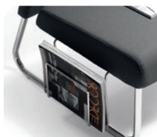
994 CR Magazine holder in chromed steel wire. Portariviste in filo acciaio cromato.