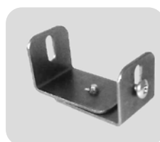
996/E Link system in chromed steel. Sistema di aggancio in acciaio cromato.