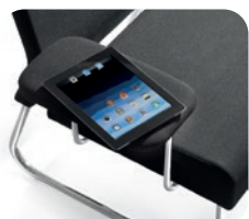
993 Armrest (Tablet holder). Bracciolo porta tablet.