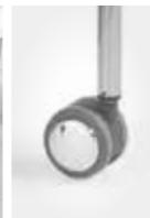
240 Caster Ruote