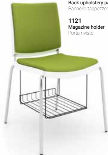
1124 Back upholstery panel Pannello tappezzeria schienale